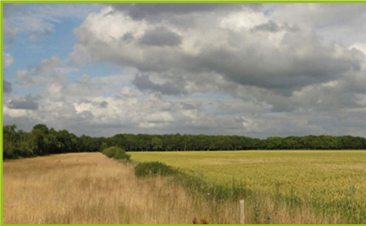
Plaats onder je foto of video een tekst. Wat zien anderen op de foto? Wie heeft de foto gemaakt?

Een nieuwsbericht is een geschreven artikel, dat als doel heeft om de lezer op een snelle en duidelijke manier op de hoogte te brengen van het nieuws. De vijf W's en de H zijn er duidelijk in terug te vinden. Hiermee zorg je dat het bericht compleet is. Je draait niet om de feiten heen, en lezers kunnen direct begrijpen wat er aan de hand is.